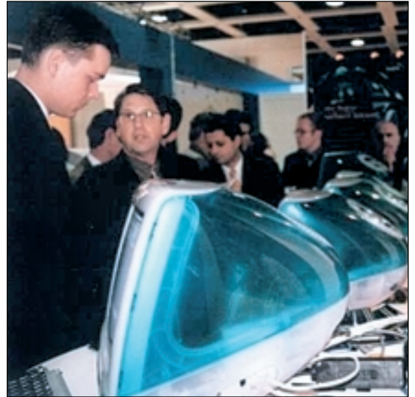
Der Stand von tourisline auf der ITB in Berlin.