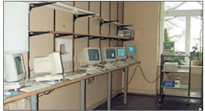
Die Mac-Theke der Kehler Anwendervereinigung.

Schüler der 5. Klasse hatten die Macintosh-Oldies in den Fächern Erdkunde und Technik auf ihre Schultauglichkeit erprobt. Die MacTheke besteht aus insgesamt acht Arbeitsplätzen und einem Druckserver, vernetzt mit Standard Ethernet. Drei Arbeitsplätze sind